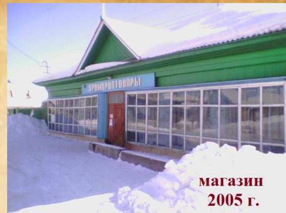
магазин 2005 г.