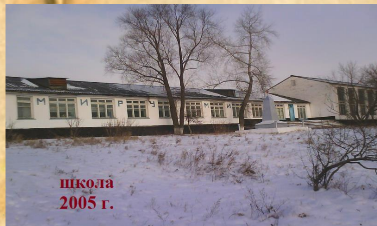
школа 2005 г.