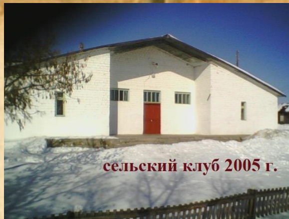
сельский клуб 2005 г.