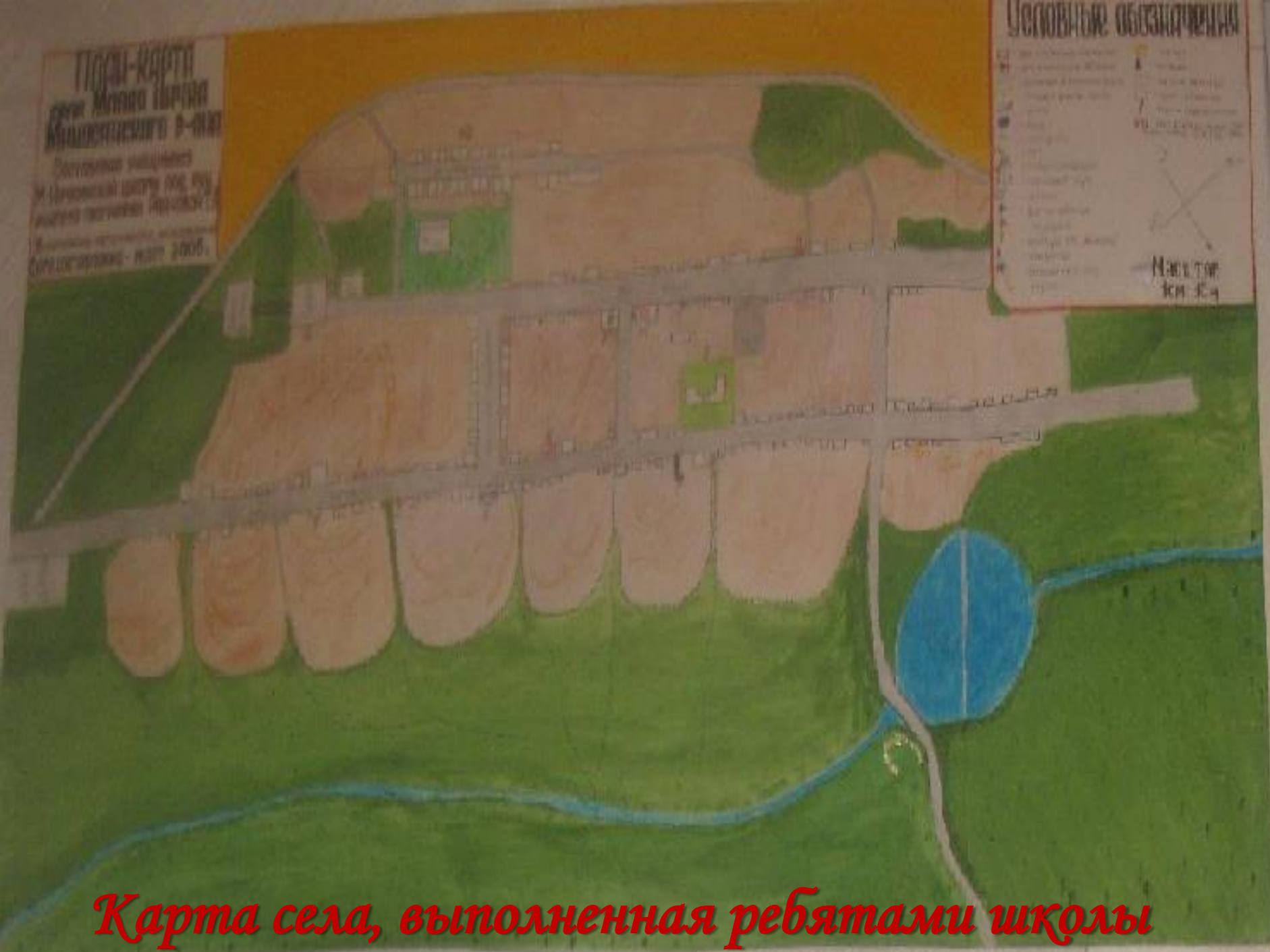
Карта села, выполненная ребятами школы

Условные обозначения 1 дерево 1 улица 2 дом 2 парк 3 сад 3 парк 4 парк 4 парк 5 парк 5 парк 6 парк 6 парк 7 парк 7 парк 8 парк 8 парк 9 парк 9 парк 10 парк 10 парк 11 парк 11 парк 12 парк 12 парк 13 парк 13 парк 14 парк 14 парк 15 парк 15 парк 16 парк 16 парк 17 парк 17 парк 18 парк 18 парк 19 парк 19 парк 20 парк 20 парк Масштаб 1 см = 20 м