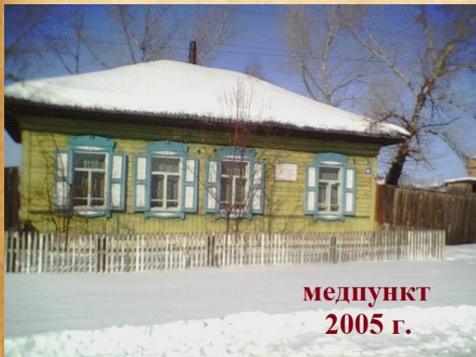
медпункт 2005 г.